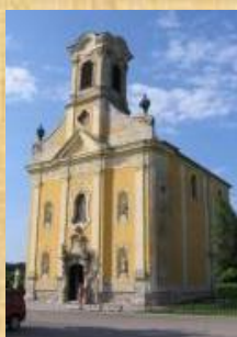
Sarlós Boldogasszony templom

„Kópháza, Nyugat-magyarországi kegyhely”